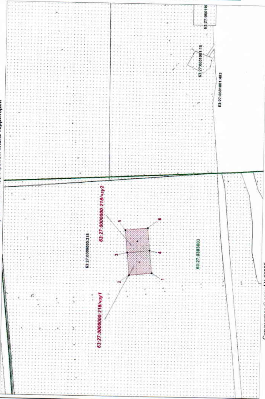
Ситуационный план М1:50000